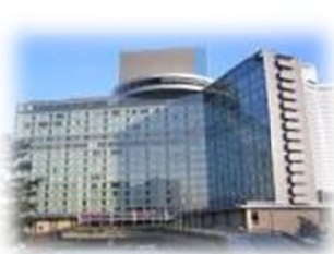
ホテルニューオオタニ