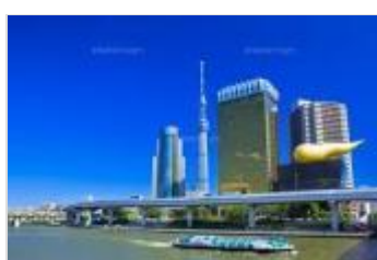
隅田川とスカイツリー