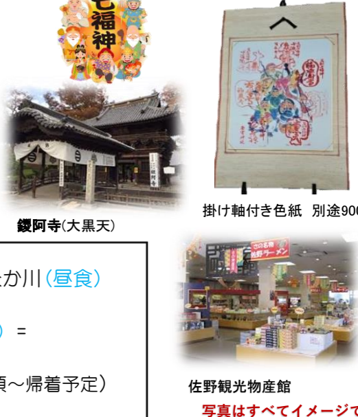
掛軸軸付き色紙 別途900

各発地 = 途中休憩 = 寿老人(参拝) = 弁財天(参拝) = めん割烹なか川(昼食) 大黒天(参拝) = 恵比寿神(参拝) = 福祿寿尊(参拝) = 毘沙門天(参拝) = 布袋尊(参拝) = 佐野観光物産館(買い物) = 途中休憩 = 各発地(18時頃～帰着予定)