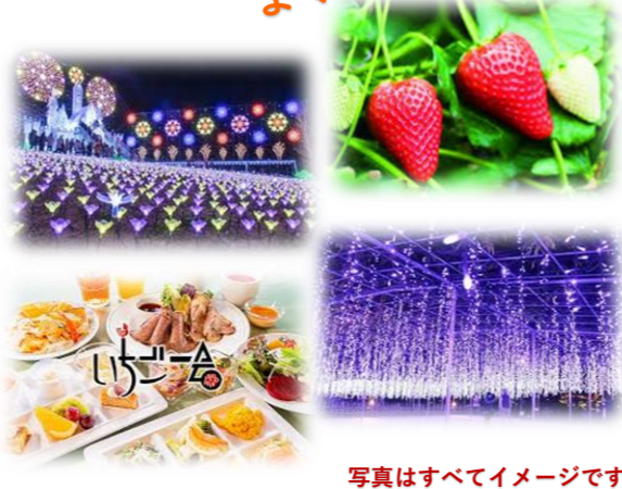
写真はすべてイメージです

各発地 = 途中休憩 = いちごの里(昼食・いちご食べ放題 30分) あしかがフラワーパーク(観光) = 発地(20時頃～帰着予定)