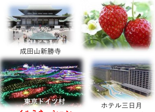
写真はすべてイメージです

【1日目】 各発地 = 途中休憩 = 成田山新勝寺(自由参拝) = 米屋観光(昼食) 東京ドイツ村(観光) = ホテル三日月(宿泊) 【2日目】 ホテル(出発) = いちご狩り(園内食べ放題) = 花摘み(水仙又はポピー) 保田漁港・ばんや(昼食) = 海ほたる(休憩) = 各発地(18時頃～帰着予定)